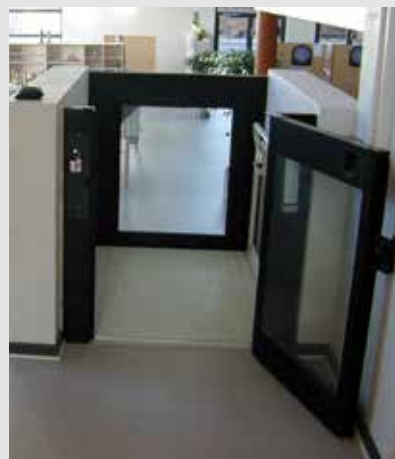
Steppy con puerta y cancela automáticas