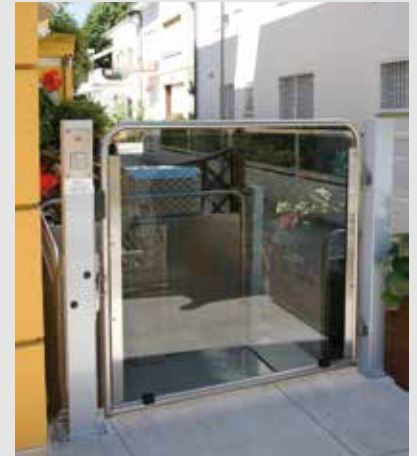
Versión de acero inoxidable (opcional)