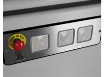
Botonera de piso Silver