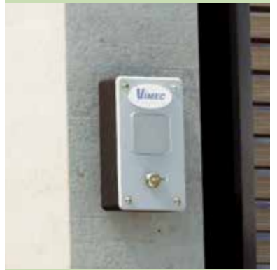
Botonera interna 50X50 mm - Silver